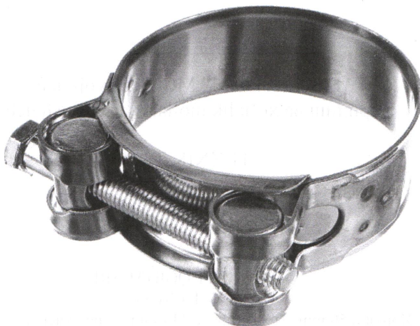
ST Truba d 114 mm – 10 metr